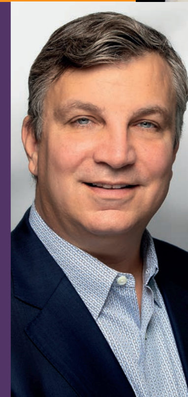
John V. Oyler, CEO BeiGene, Bâle

«La région compte plus de 700 fabricants biopharmaceutiques allant de la petite entreprise aux géants tels que Novartis et Roche. Le choix du site géographique revêt une importance capitale dans la mesure où l'on souhaite intégrer l'Europe dans sa vision d'entreprise globale.»