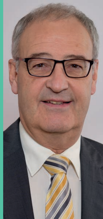
Guy Parmelin, Conseiller fédéral

«Le pôle des sciences de la vie de la région Basel Area revêt une importance capitale pour l'économie nationale, et occupe une position de pointe en Europe et dans le monde.»